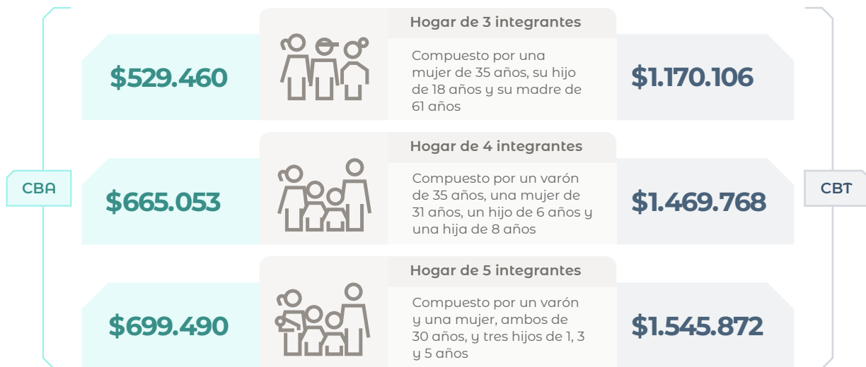
Variaciones porcentuales de las canastas respecto al mes anterior