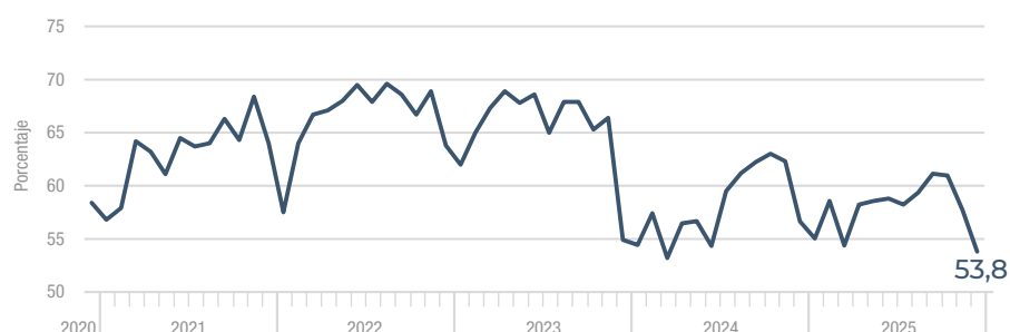
Utilización de la capacidad instalada en la industria Diciembre 2020-diciembre 2025