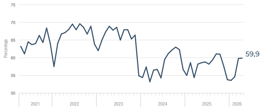
UCII. Abril 2021-abril 2026