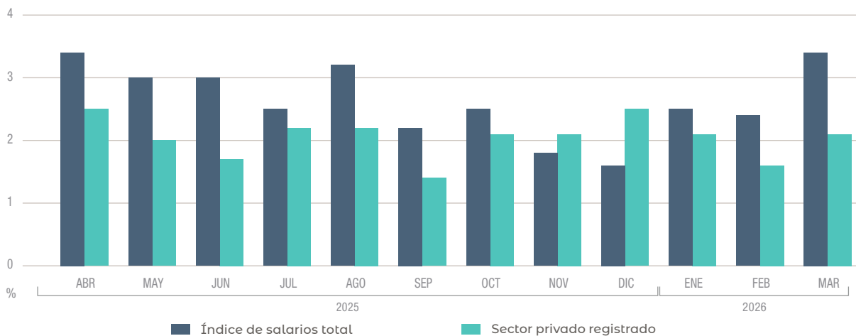
Variación porcentual respecto al mes anterior

v.m variación % mensual v.ia variación % interanual v.a variación % acumulada