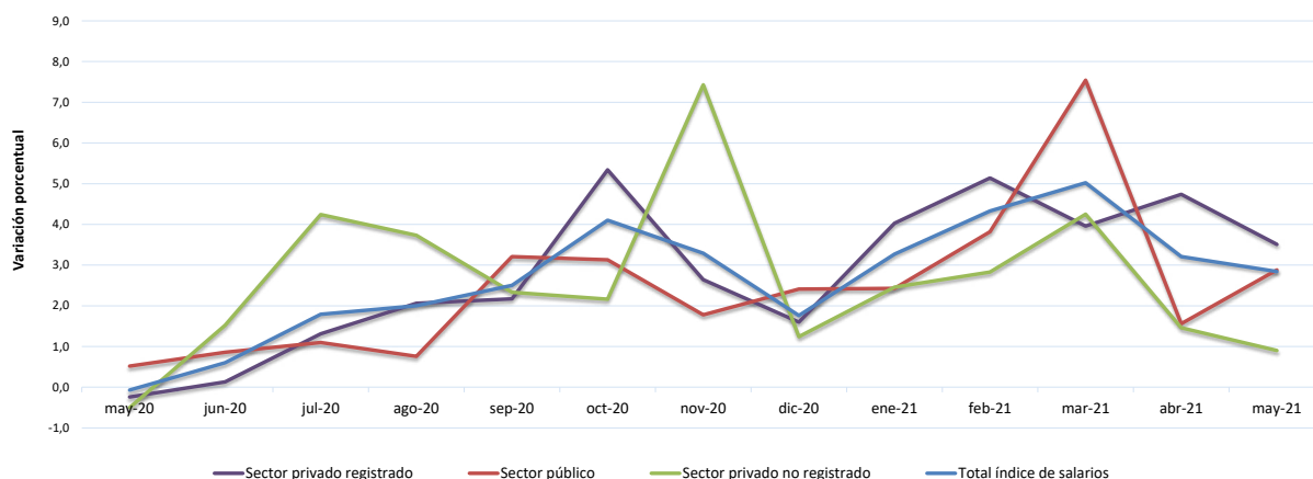
Gráfico 1. Total índice de salarios, sector privado registrado, sector público y sector privado no registrado, variaciones porcentuales respecto del mes anterior. Mayo 2020-mayo 2021